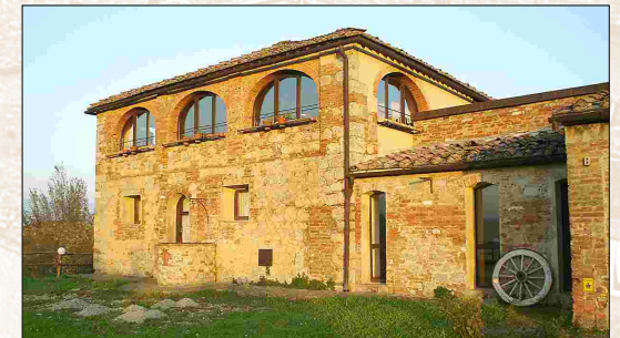
Ristorante Osteria Pozzo di Radi