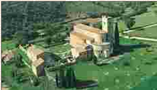
Abbazia di Sant'Antimo

La manifestazione sarà seguita da un'azienda nel settore fotografico, per poter avere alla fine della manifestazione le foto della stessa, su supporto CD rom, escluso dalla quota di partecipazione.